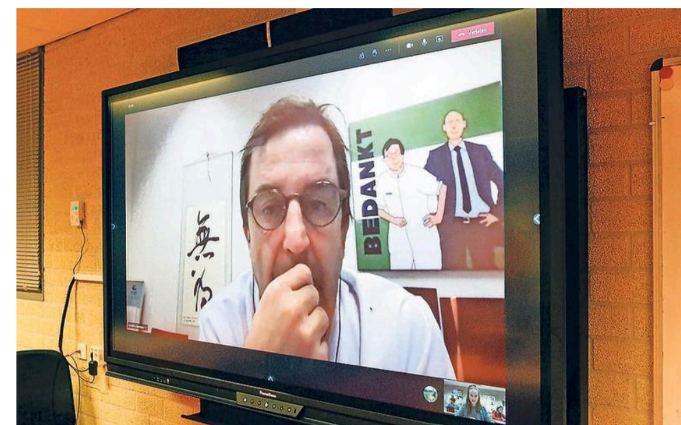
„Heel veel zaken zijn belangrijk, niet alleen het ziekenhuis.”

REPORTAGE Gommers in gesprek met Soester leerlingen