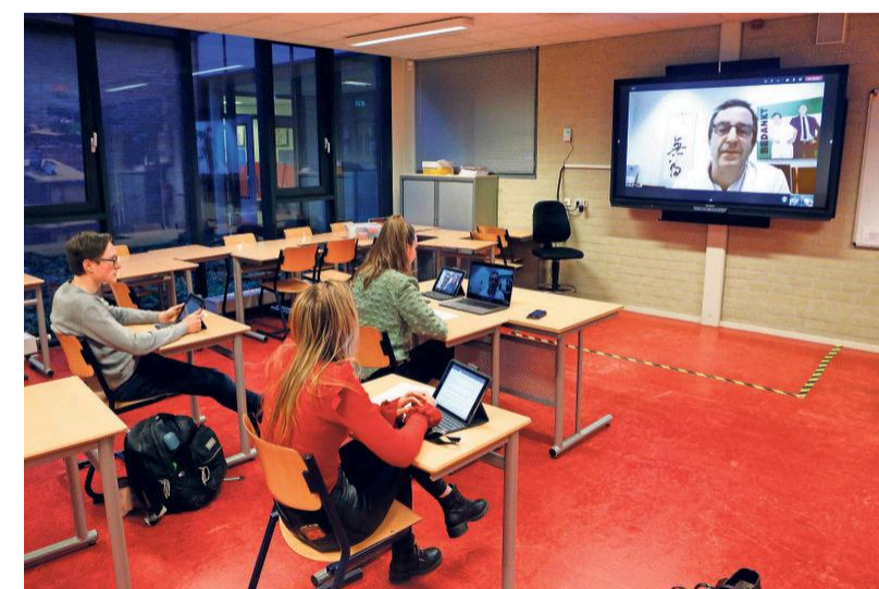
„Ik wil dat jongeren vreedzaam gaan roepen dat ze er klaar mee zijn.”

Bewust van de aanwezige pers schiet hij echter snel weer in zijn rol. „Ja, dat kan natuurlijk niet, maar er kan wel naar mogelijkheden gezocht worden. We moeten gaan kijken wat nog wel kan.”